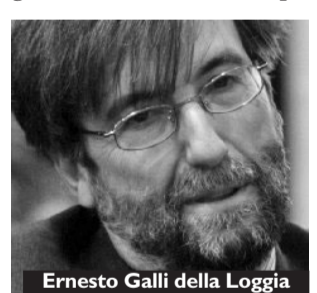
Ernesto Galli della Loggia

Ernesto Galli della Loggia, docente di storia contemporanea ed editorialista del Corriere della Sera , un convegno su "Dio oggi" sembra un'occasione felice per uscire, almeno per una volta, dai battibecchi laico-cattolici su ingegneria vaticana, legge 40, Concordato, eccetera. E per fermarsi a riflettere sull'impatto che il Dio cristiano ha avuto sullo sviluppo politico dell'Occidente. Professore, da contemporaneo cosa la colpisce ripensando alla rivoluzione cristiana?